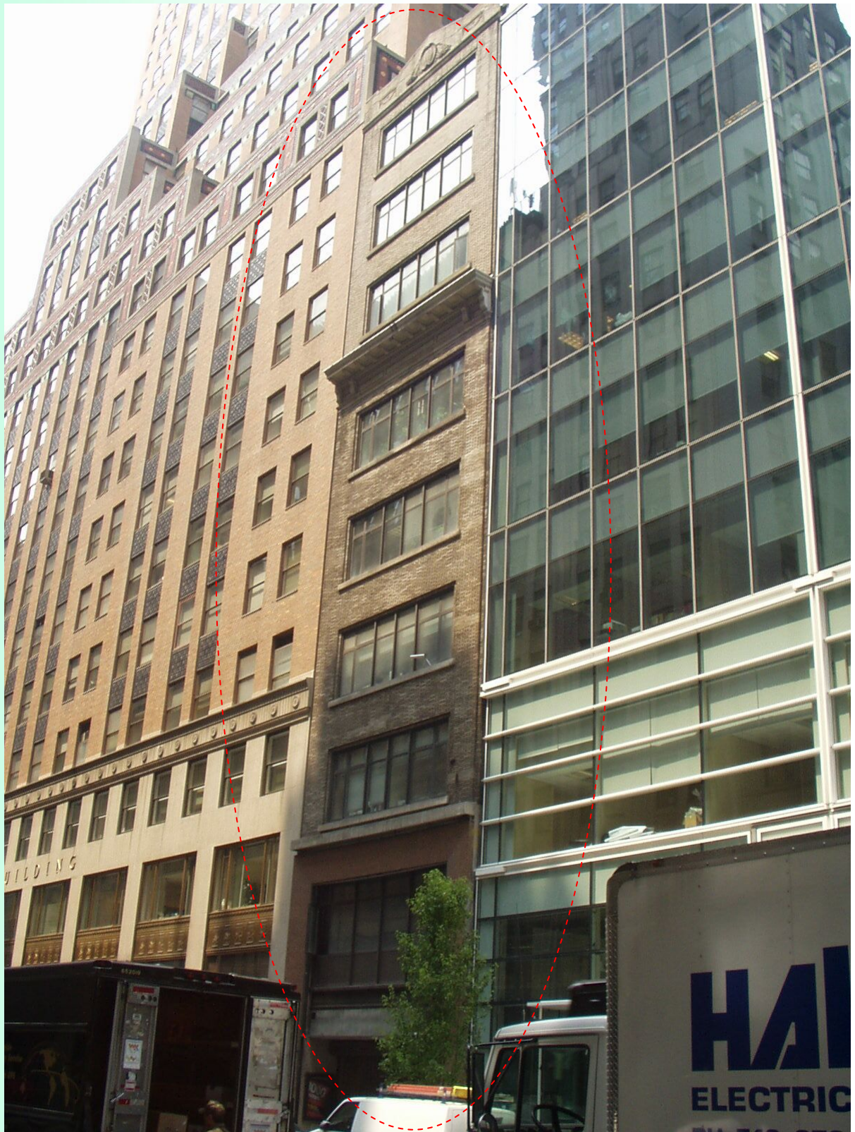
物件全景(地下1階、地上9階)